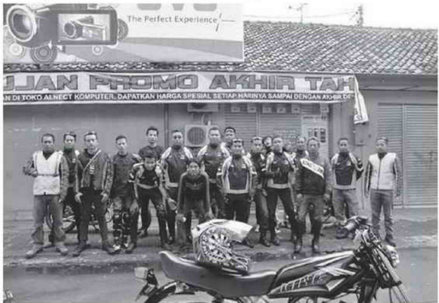
JANTI King Squad (Jankis) adalah komunitas penggemar Yamaha RX King. Jankis akan menggelar bakti sosial pada 10 Januari 2016 di kawasan wisara Kaliurang Sleman. (ang)